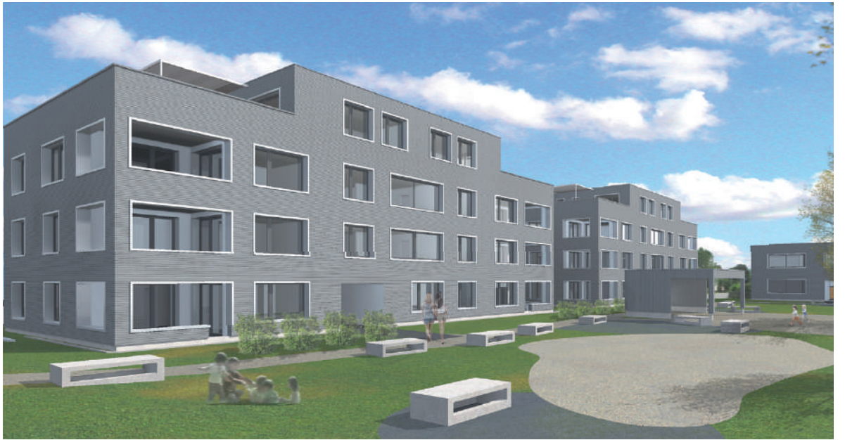
Die nach Minergie-P und Minergie-ECO zertifizierte Überbauung mit grosszünftig gestalteter Umgebung ist ab Ende März 2019 etappenweise bezugsbereit.

Das aargauische Leuchtturmprojekt «swisswoodhouse» in Möriken ist bald bezugsbereit